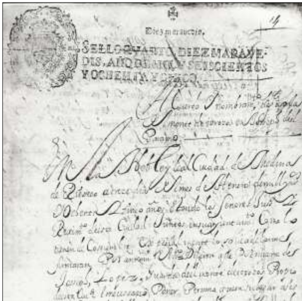
Acta del ayuntamiento de Medina de Rioseco nombrando Comisarios del Monte para 1865

Y como cualquier cargo público tenía que jurar el mismo. Y ese juramento no se hacía en Medina de Rioseco ante su Alcalde, sino que éste delegaba esa tarea en sus Comisarios del Monte (dos personas encargadas de controlar y vigilar todo lo que aconteciera en el Monte de Torozos, propiedad entonces como la Mudarra, de Medina de Rioseco). Era un juramento público en la plaza del pueblo que se solía hacer muy pronto para que no hubiera ninguna dejación de funciones. Eso siempre que no hubiera reclamaciones al nombramiento, porque entonces todo se dilataba hasta resolver el litigio. Litigios que surgían por rencillas o enemistades entre vecinos nombrados o no, por vínculos de parentesco entre nombramientos consecutivos, por defectos en inventarios económicos o materiales, etc.